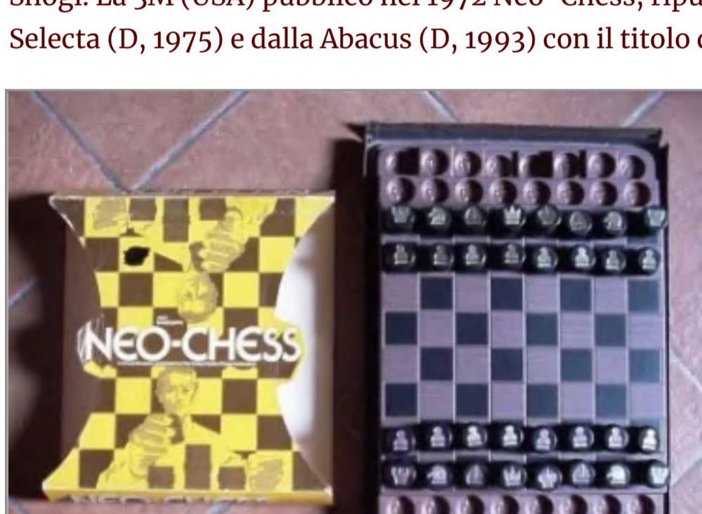
Neo-Chess (3M, 1972)