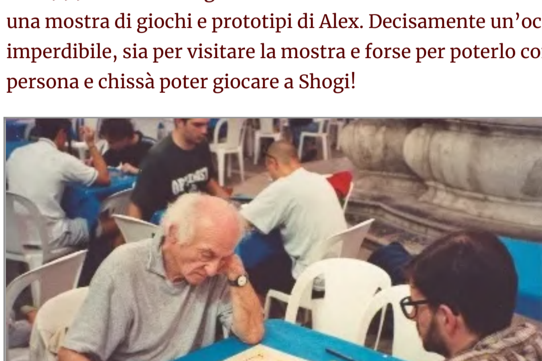
Festival Italiano dei Giochi (Cagliari 1999)

Nel 1999 si tenne a Cagliari il Festival Italiano dei Giochi con in programma una mostra di giochi e prototipi di Alex. Decisamente un'occasione imperdibile, sia per visitare la mostra e forse per poterlo conoscere di persona e chissà poter giocare a Shogi!