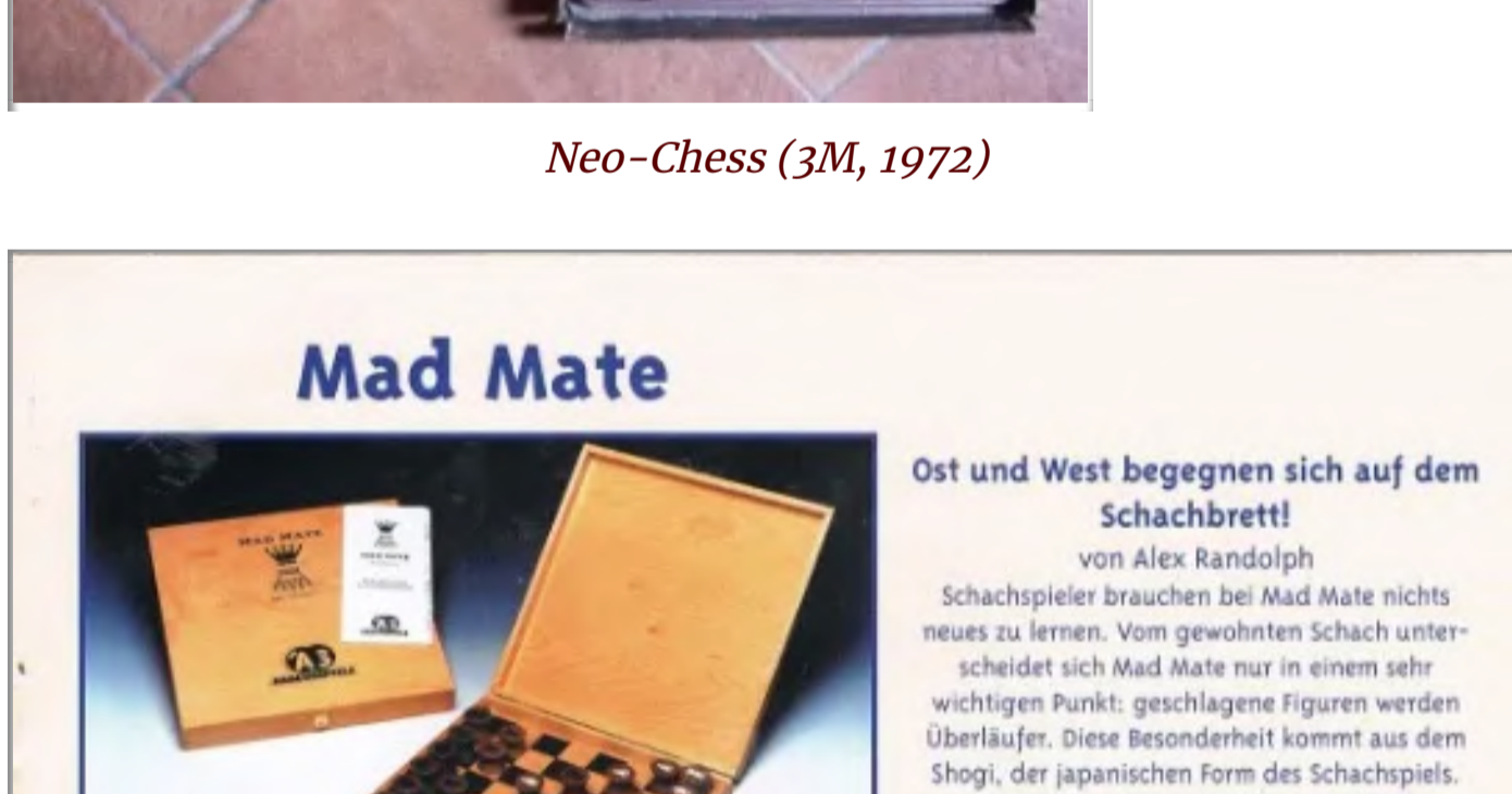
Mad Mate (Abacus, 1997)

Nel 1999 si tenne a Cagliari il Festival Italiano dei Giochi con in programma una mostra di giochi e prototipi di Alex. Decisamente un'occasione imperdibile, sia per visitare la mostra e forse per poterlo conoscere di persona e chissà poter giocare a Shogi!